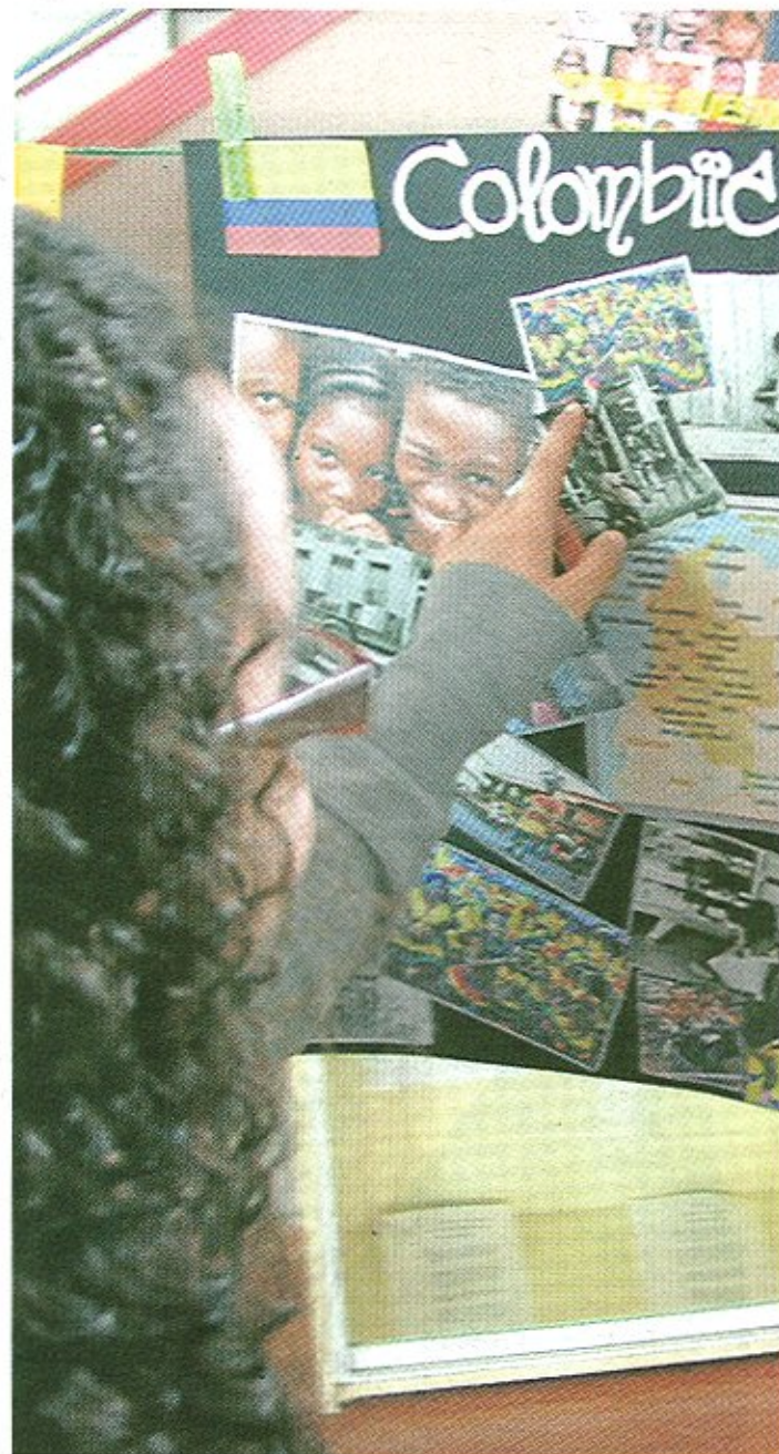
Alumnos inmigrantes mostran a súa cultura

Cano está a piques de rematar a primeira experiencia que se fai con xoves de diferentes nacionalidades a técnica responsable chama a atención sobre a comunidade chinesa: "No Antón Fraguas de Santiago hai un importante